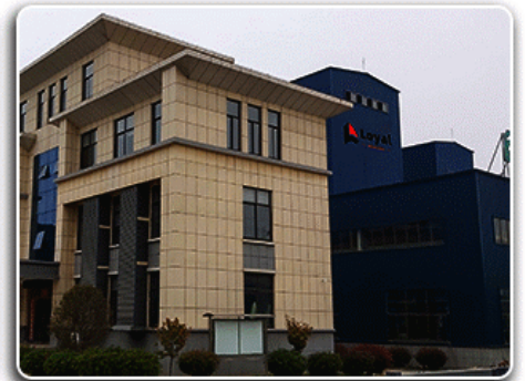
FOTO DA FÁBRICA DA LOYAL